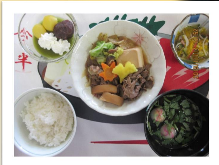
今回は毎年恒例 今半のすき焼きです